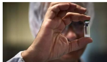
Illustration : Une fiole de vaccin dans une usine du groupe pharmaceutique Sanofi Pasteur à Marcy-l'Etoile (Rhône), le 7 juillet 2016.

Cet article, un peu plus long que le deuxième, parle des effets secondaires soupçonnés sur d'autres vaccins que celui contre la Covid-19. Chaque parties de l'article se concentre sur un vaccin et est découpé en 3 parties : « D'où viennent les soupçons d'effets secondaires ? Le lien avec ces vaccins est-il établi ? Quelles décisions ont pris les autorités sanitaires ? ». Pour résumer, les soupçons ne viennent jamais de nulle part mais une enquête approfondie arrive rarement à prouver le risque d'effets secondaires. Sans preuves, les autorités sanitaires prennent le plus souvent de petites mesures pour rassurer ou même aucune si il est confirmé qu'il n'y a aucun effet secondaire. Les vaccins étudiés dans l'article sont : ceux utilisant de l'aluminium, celui contre hépatite B, celui contre le papillomavirus humain, celui contre la Rougeole Oreillons Rubéole, contre le H1N1, contre les rotavirus et enfin celui contre la dengue.