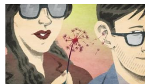
Illustration : pas de légende

Cet article parle des rumeurs et des complotistes. Il explique l'origine d'une rumeur, quel type de personnes lancent une rumeur, de sa transformation en théories du complot. Il évoque les moyens de contrer une rumeur mais pourquoi il est difficile de l'endiguer. Un passage plutôt marquant est : « [...] les tenants de la rumeur se placent dans une posture de défiance, car ils considèrent qu'on leur cache quelque chose. Or, précisément, ce qu'ils croient qu'on leur cache sont les rumeurs qu'ils vont faire circuler. »